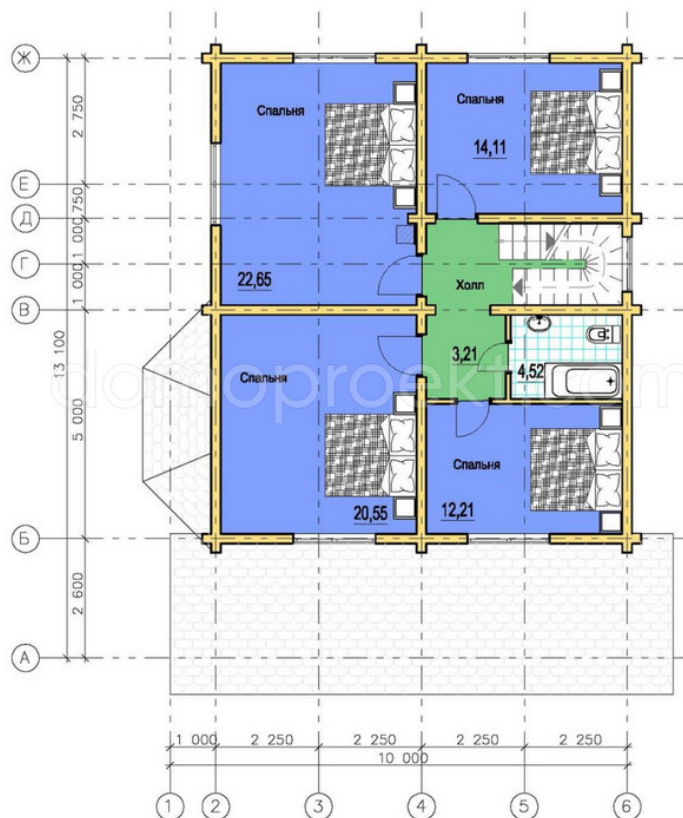
План 2-го этажа