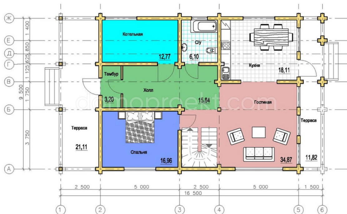
План 1-го этажа