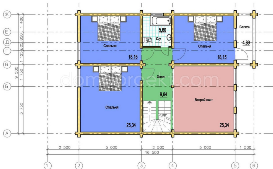
План 2-го этажа